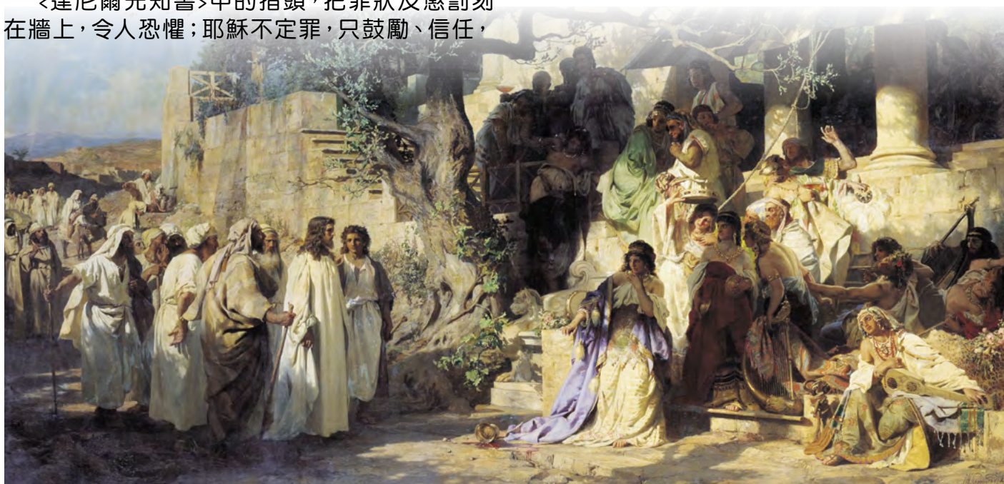
Christ and Sinner, 1873 by Henryk Siemiradzki

真福教宗若望保祿二世在他的一封頒發於一九八八年，以「論女性的召叫及尊嚴」(MULIER- ISDIGNITATEM)的宗座勸諭中引出這個片段，作了一些精闢的解釋，並將之應用在今日社會上。他指出，姦淫這罪不是人單獨犯的，在淫婦背後有一個不動聲色、不露面、逍遙法外的姦夫。其實，按梅瑟法律兩人都應受罰：「若人與一有夫之婦通姦，即與鄰友之妻通姦，姦夫姦婦應一律處死」(肋20:10；申22:22)。但很多時，婦女要背負「自己的」，再加上「別人的」罪過，要孤獨無助地為自己及為別人承受這罪過的後果及責任，被人拋棄，被輕看，被斥責，忍受心靈創傷及家庭、社交生活的破裂。今日仍有很多婦女，等待擁有耶穌精神者與他們一起改變這不平不公，讓他們感受到被愛，被尊重。■