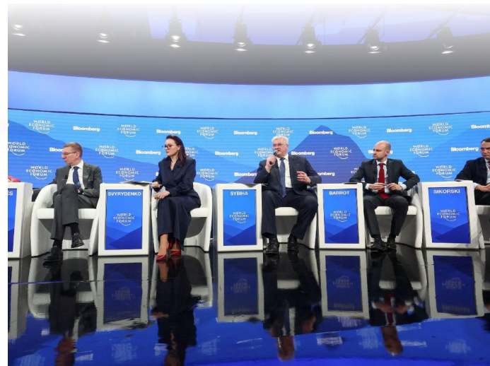
55th annual World Economic Forum (WEF) meeting in Davos

鏈接網址： https://www.vaticannews.va/zht/pope/news/2025-01/pope-francis-sends-message-to-davos.html ■