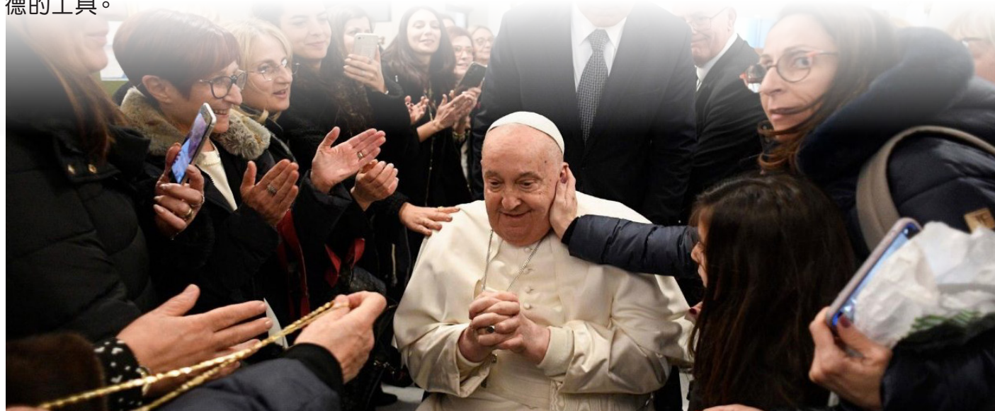
55th annual World Economic Forum (WEF) meeting in Davos

鏈接網址： https://www.vaticannews.va/zht/pope/news/2025-02/pope-francis-meeting-obstetricians-gynecologists-calabria-life.html ■