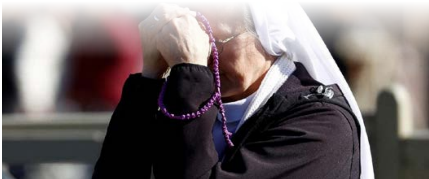
Plaza San Pietro, una suona in preghiera per la salute di Francesco

鏈接網址： https://www.vaticannews.va/zht/pope/news/2025-02/papa-angelus-domenica-giubileo-artisti-ricovero-gemelli.html ■