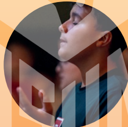
Conversion of Heart 心灵皈依