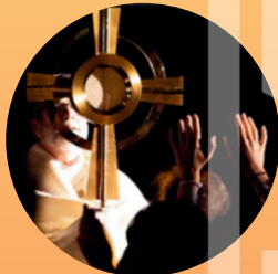
Encounter Christ 与基督相遇

Cost: Around $490 (will be lowered via fundraising) - includes transportation, meals, lodging, and two T-shirts 费用：约$490 (將會有籌款活動以降低費用) - 包括交通、食物、住宿和两件T恤 有 2 名以上青少年參加的家庭可獲得 $100 補貼