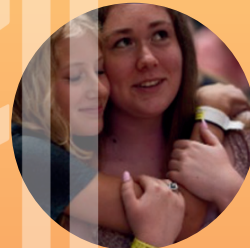
Peer Fellowship 信仰交流

“FOR THE LORD, YOUR GOD, IS A CONSUMING FIRE, A JEALOUS GOD.” DEUTERONOMY 4:24