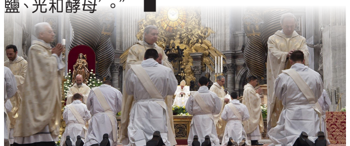
聖伯多祿大殿內的祈禱團體

“凡是傾聽天主召叫的人，不能無視那些被排斥、受傷和被遺棄的兄弟姐妹的呼聲。每一種聖召都開啟了一項使命，那就是在最需要光明和安慰的地方成為基督的臨在。尤其是平信徒，他們蒙召透過社會和職業的奉獻，成為天國的‘鹽、光和酵母’。” ■