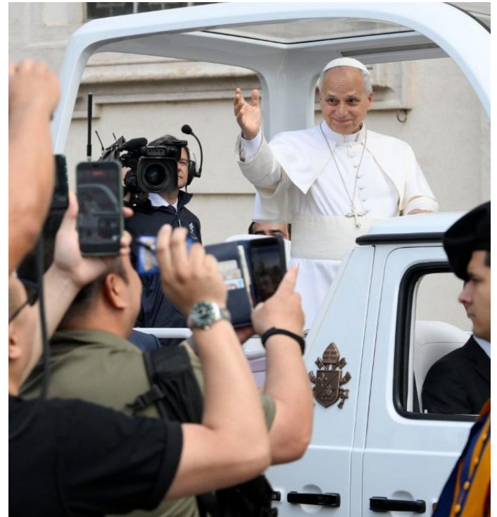
Libera Generale

此外，教宗用意大利語向講中文的人們致以誠摯的問候，說：“親愛的弟兄姐妹們，願你們切莫倦怠，無論何處，成為友愛與和平的見證者。我衷心地降福你們！” ■